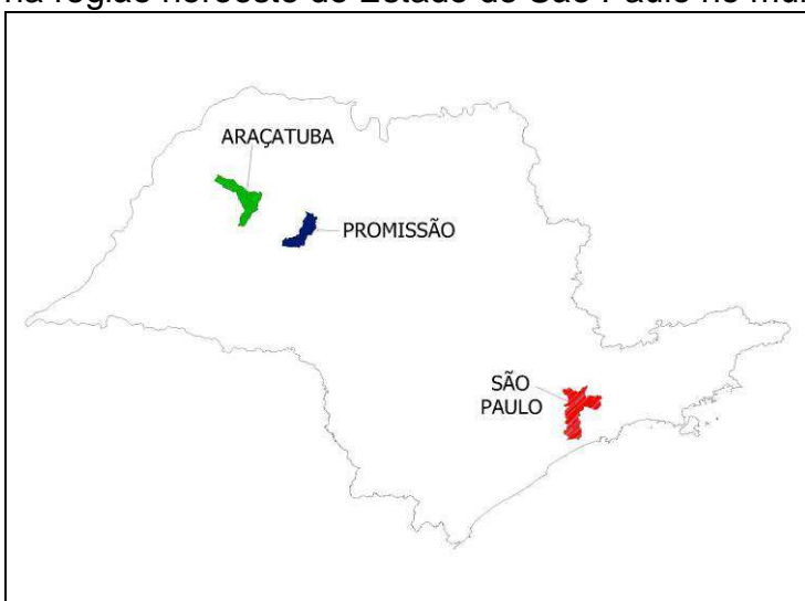
Mapa 1. Mapa do Estado de São Paulo com a localização do município de Promissão.

A área de estudo compreende a bacia hidrográfica do Córrego Gonzaga, localizado na região noroeste do Estado de São Paulo no município de Promissão.