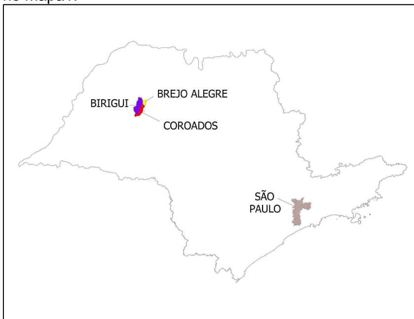
Mapa 1. Mapa do Estado de São Paulo com a localização do município de Birigui e Coroados.

A área de estudo compreende a bacia hidrográfica do Córrego do Baixote, localizado na região oeste do Estado de São Paulo no município de Birigui, conforme ilustrado no mapa 1.